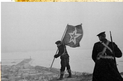
Советские морские пехотинцы устанавливают корабельный гроб на самой высокой точке Керчи – горе Митридат. Апрель 1944 года.

За время боев в городе было уничтожено более 85 процентов зданий. Освободителей встретили чуть более 30 жителей из почти 100 тысяч, населявших город до войны.